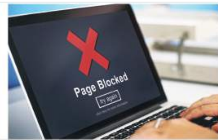
لكن بعد إبراز واحدة من هذه الوثائق، وأقر هذا القائمون المعروف باسم "حجب المواد الإباحية" عام ٢٠١٧.

المشتر القديم، لكن يمكن أن يطرأ تأجيل على تطبيقه، حيث أن وزارة الرققيات والثقافة والرياضة والإعلام، لم تؤكد ما إذا كان التاريخ السابق ما يزال ساريا، لكن وسائل إعلام بريطانيا أوضحت أن التطبيق "شيك". وتشير إحصائيات مؤسسات معينة بحماية الأطفال، إلى أن نحو نصف الأطفال والمراهقين الذين تقل أعمارهم عن ١٨ في بريطانيا يوافقون على الدخول للمواقع الإباحية. لكن هناك من يشكك في نجاح هذه الإجراءات في إبعاد هؤلاء عن تلك المواقع، لأسباب، منها ما يتعلق بكيفية رصد المواقع الإباحية غير المعروفة، وإمكانية سرقة البطاقات الشخصية الآخرين واستخدامها لهذا الغرض.