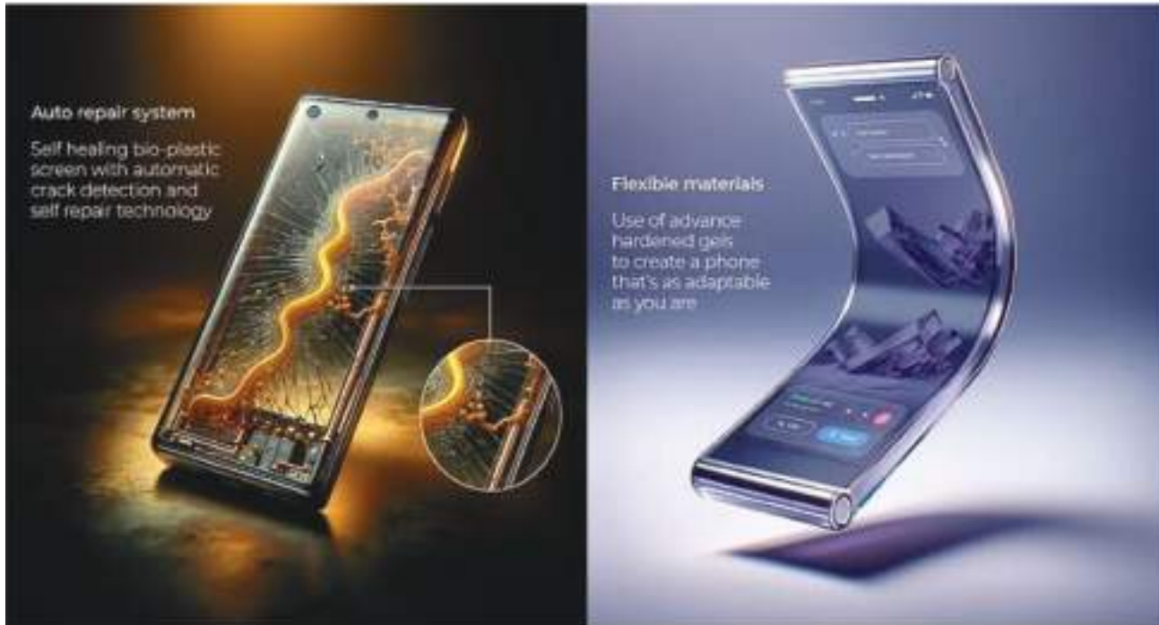
Auto repair system

Self healing bio-plastic screen with automatic crack detection and self repair technology