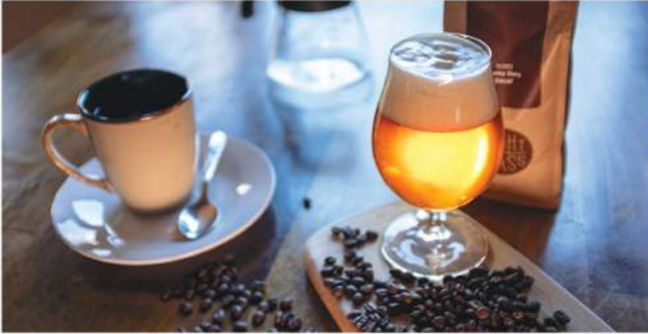
خطر الإصابة بالقصور الكلوي، وبالإضافة إلى هذا، يعمل الكحول على تثبيط الجهاز العصبي المركزي، أما الكافيين فيحفز، وبالتالي تسوء نوعية النوم وغير ذلك من الآثار السلبية بما فيها الإصابة بقرحة المعدة.