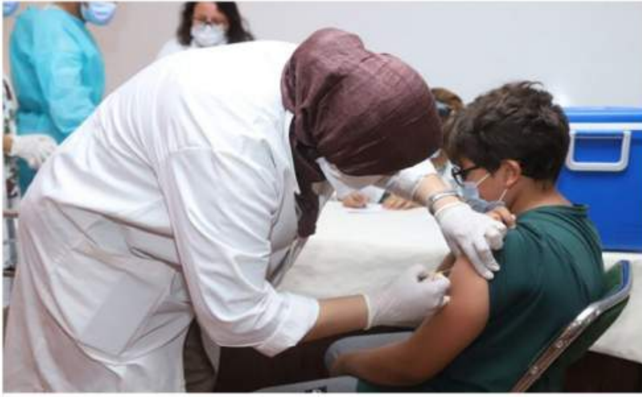
أكثر، إذا لم يتسبب في مضاعفات خطيرة كالتهاب العنكبوتية أو دموع إحداهما. فضلا عن التهاب السحايا الفيروسي، أو انتقاله لدماع الانسان، في أشهرها الأولى، عن طريق العدوى، فير أنه لن يسبب لها مضاعفات خطيرة. وأكد أن الفيروس يمكن أن ينتقل للمرأة الحامل والخسيتين أو دمور إحداهما. فضلا عن التهاب

يعاني عدد من الأطفال خلال هذه الفترة من انتقال العدوى العنكبوتية على أحد الجانبين أو كلاهما. نتيجة للإصابة بفيروس يسمى "الكفاف"، وهو مرض معدى يصيب الأطفال في جميع الفئات العمرية وله مضاعفات وأعراض خطيرة. فما هو هذا المرض؟ وأين تكمن خطورته؟ وكيف يمكن الوقاية منه؟ "الكفاف" هو مرض فيروسي يصيب الغدد العنكبوتية وهي واحدة من ثلاثة أزواج من الغدد "العنكبوتية" المنتجة لللعاب، وتقع تحت وأمام الأذنين. ويمكن أن يسبب تورهما الألم عند اللمس. يشرح الطبيب حمضي الطبيب والباحث في المسائات والنظم الصحية، أنه من أهم الأمراض التي يسببها هذا الفيروس هي التهاب الغدد العنكبوتية على أحد الجانبين أو كلاهما، والحمى، والصداع، بالإضافة إلى الإحساس بالتعب وفقدان الشهية. بالإضافة إلى الألم أثناء المتغ أو البلع. وأضاف حمضي، في تصريح لوقع الأولى، أن ٩٠ في المائة من الأشخاص الذين يصلون لمنزلة البلوغ يكونون قد أصيبوا بالكفاف في صغر سنهم. فير أن الدول التي تعمم التطعيم ضد هذا المرض في صفوف مواطنيها لا تعرف حالات كثيرة، وبانت لتسجيل حالات إصابة عند كبار السن الذين لم يسبق لهم التطعيم ضد هذا الفيروس في مرحلة الطفولة. ويوضح أن ٣٠ في المائة من الأطفال الذين يصابون بهذا الفيروس لا تظهر عليهم أعراض الإصابة، بينما أن ٧٠ في المائة من الصابين به تظهر عليهم هذه الأعراض، مؤكدا أن مدة الإصابة بهذا المرض قد تصل إلى عشرة أيام أو