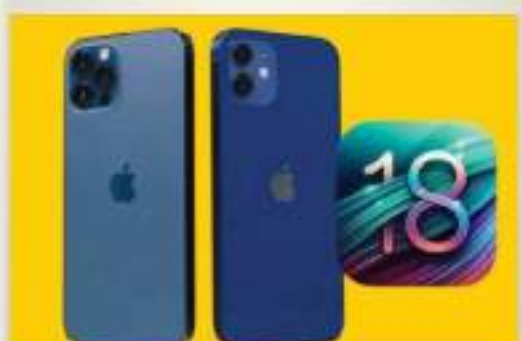
توقع خبراء أن تصدر أبل أكبر تحديث لنظام iOS في تاريخ الشركة، وقد يتضمن ميزات جديدة مدعومة بالذكاء الاصطناعي لجهاز "آيفون".

يتوقع خبراء أن تصدر أبل أكبر تحديث لنظام iOS في تاريخ الشركة، وقد يتضمن ميزات جديدة مدعومة بالذكاء الاصطناعي لجهاز "آيفون". ومن المتوقع أن تعلن الشركة عن تحديث iOS 18 في مؤتمر المطورين العالمي في يونيو، والذي سيمدح نماذج لغات الكيفية (LLMs) والذكاء الاصطناعي التوليدي في تطبيقات iWork. وتأتي بعض تحديثات البرامج المتوقعة كنسخة منقحة من Siri وتطبيق الرسائل، والتي يقال إنها مدعومة بالذكاء الاصطناعي المتقدم. ويمكن أن تصدر أبل النسخة التجريبية من تحديث iOS 18 في يوليو من هذا العام، مع إصدار عام مقدر في سبتمبر 2024. ولم تؤكد شركة أبل رسميا بعد ما سيتم تضمينه في نظام iOS 18 الجديد، لكن مارك غورمان من "بلومبرغ" أفاد أن نظام التشغيل القادم "مشوح ومفتح". وتوقع غورمان أن iOS 18 سيمدح للمستخدمين بإنشاء "قوائم تشغيل تلقائية" تستخدم الذكاء الاصطناعي لإنشاء قوائم الأغاني الموسي بها. وكتب غورمان، فيل لي أن نظام التشغيل الجديد ينظر إليه داخل الشركة باعتباره أحد أكبر تحديثات iOS - إن لم يكن الأكبر - في تاريخ الشركة، وبهذه المعرفة، ينبغي أن يكون مؤتمر مطوري أبل في يونيو مثيرا للغاية". وقد يكون نظام التشغيل القادم تصميمه بمثابة رد أبل على تراجع مبيعات "آيفون 15" الذي شهد انخفاضا بنسبة أربعة بالمائة.