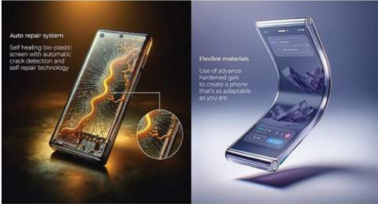
Auto repair system

Self healing bio-plastic screen with automatic crack detection and self repair technology