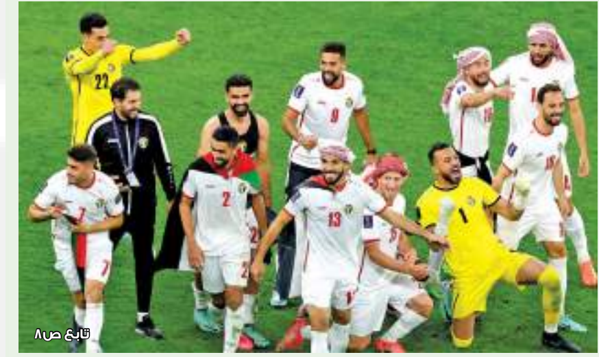
تابع ص ٨