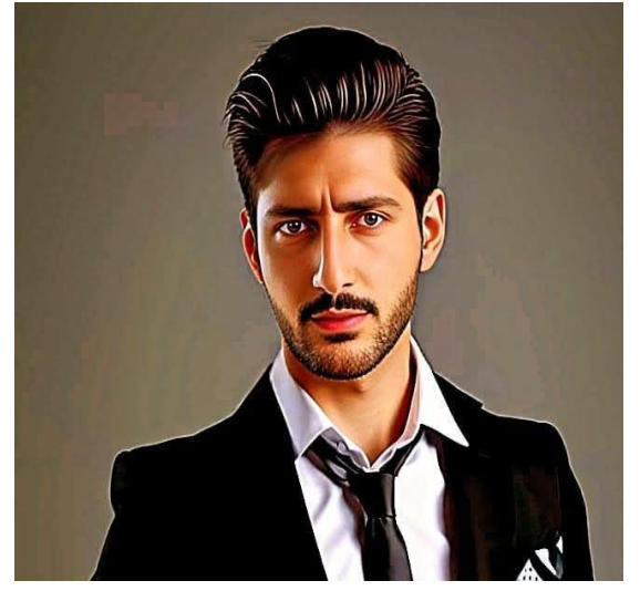
بقلم الإعلامي داود حميدان

منذ اعتلائه العرش، وجملة الملك عبدالله الثاني يقدم نموذجاً استثنائياً للقيادة الحكيمة، المدافعة عن القضايا العربية والإسلامية، وفي مقدمتها القضية الفلسطينية وجاء الجهد الملكي السياسي والأغاثي والإنساني في حرب غزة التي تعيش نشوة الانتصار اليوم، يتجلى الموقف الأردني بقيادة جلالتة في أبهى صور الدعم والتضامن مع الأشقاء، ليؤكد مرة أخرى أن الأردن سيظل الحصن المنيع والأقرب لقب فلسطين ويتوجهات جلالة الملك انطلقت قوافل المساعدات الإنسانية لعل ليس آخرها القافلة الإنسانية الكبيرة التي شهدتها جلالة الملك شخصياً في مركز الهيئة الخيرية الهاشمية التي تحركت لأهل غزة قبل أيام، ولم يقتصر الدور الأغاثي عبر البر من خلال الشاحنات المحملة بأطنان من المواد الغذائية الإغاثية طوال فترة الأزمة بل كان عبر الجو بالطائرات الملكية وعملية الإنزال الجوي للمواد الغذائية والطبية ولم تقتصر المساعدات على ذلك، بل شملت إقامة مستشفيات ميدانية داخل غزة، تعمل على تقديم الرعاية الصحية العاجلة، وتخفيف معاناة الجرحى والمضربين من العدوان الصهيوني.