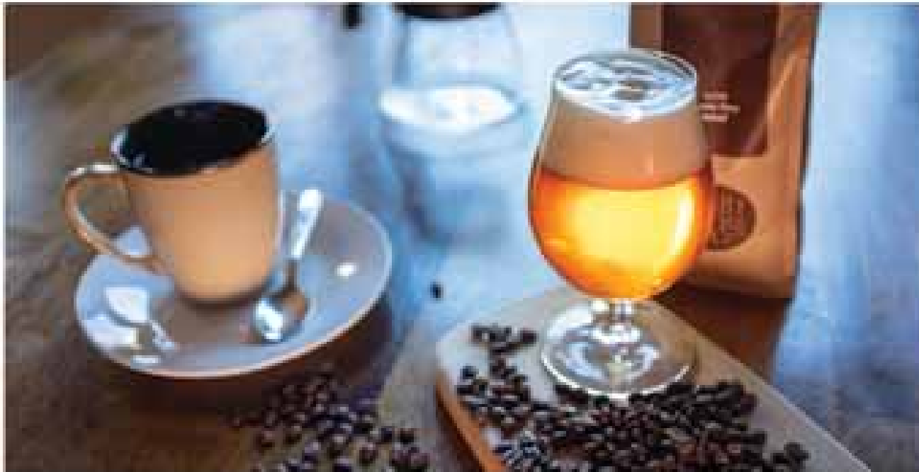
خطر الإصابة بالصدور الكولي، وهذا يزيد من خطر الإصابة بالتهان والصاب. وبالتالي لبدء يومه التوم وغير ذلك من الآثار السلبية بما فيها الإصابة بقرحة المعدة.