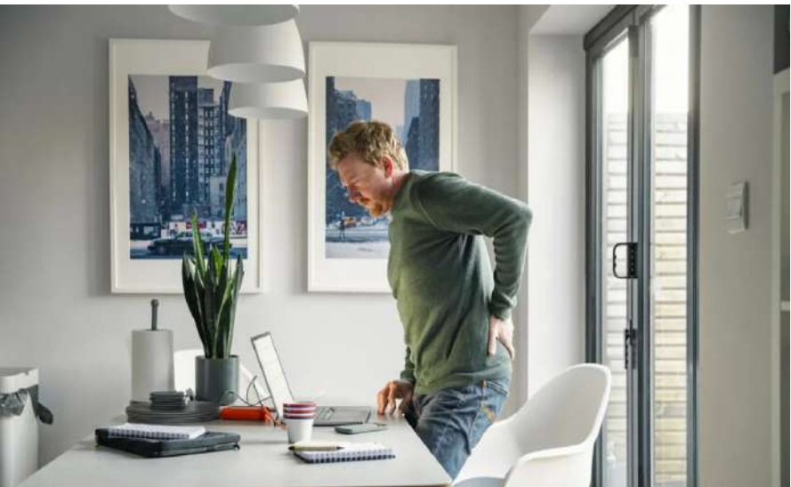
بآلم في الظهر.

الحقيقة: على العكس، يُعد النشاط البدني المنتظم والتمارين المناسبة، خصوصاً تمارين تقوية العضلات الأساسية وتحسين المرونة، من أهم وسائل العلاج والوقاية. ويجب فقط تعديل شدة التمارين حسب درجة الألم، واستشارة الطبيب إذا استمر أو ازداد.