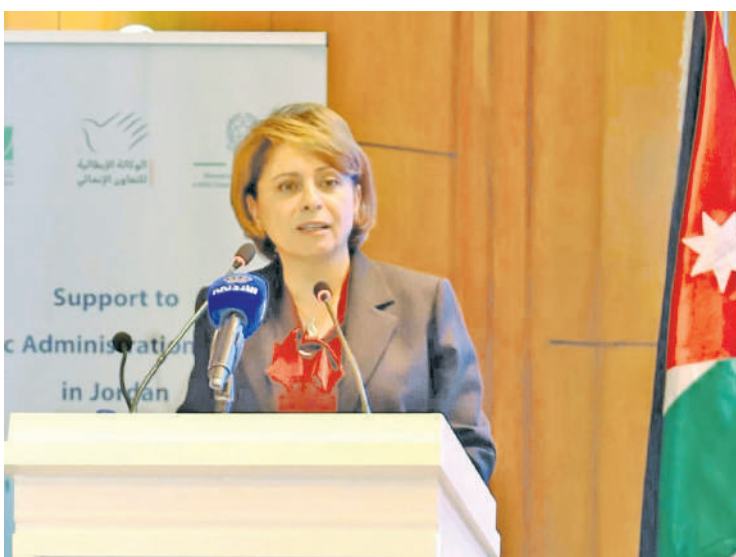
وزير الإدارة العامة، القائمة على تعزيز الكفاءات والمهارات بما يواكب الاتجاهات العالمية وتوسيع فرص الوصول إلى التدريب، وضمان وإرساء منظومة مرنة للتعليم الذاتي والرقمي

عمان أكدت وزيرة دولة لتطوير القطاع العام المهندسة بدرية البليسي أن تحويل معهد الإدارة العامة إلى الأكاديمية الأردنية لإدارة الحكومية جاء في إطار التطوير المؤسسي الشامل والتحول البنوي المدروس لدور المعهد ووظيفته، بما يواكب متطلبات الدولة الحديثة ويضمن مواكبة بناء القدرات الحكومية مع التوجهات في الرقمنة، والبيانات، والذكاء الاصطناعي والاقتصاد الرقمي، ويتسق مع أولويات وأهداف البرنامج التنفيذي الثاني لخارطة طريق تحديث القطاع العام (٢٠٢٦-٢٠٢٩). وبينت البليسي خلال مداخلة هاتفية على الإذاعة الأردنية الانثن، أن الأكاديمية ليست كيانا جديدا أو هيئة مستقلة جديدة في الجهاز الحكومي، بل تعد الخلف القانوني والواقعي لمعهد الإدارة العامة. وأكدت أن الأكاديمية ستعمل على تطوير منظومة حديثة ومرنة لبناء القدرات الحكومية، القائمة على تعزيز الكفاءات والمهارات بما يواكب الاتجاهات العالمية وتوسيع فرص الوصول إلى التدريب، وضمان وإرساء منظومة مرنة للتعليم الذاتي والرقمي