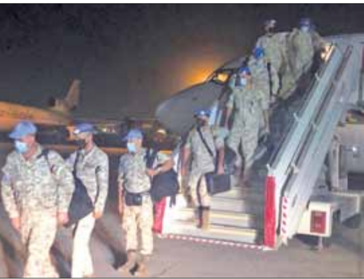
وتقديم مختلف أشكال المساعدات الإنسانية للدول التي تشهد الحروب الأمم المتحدة.