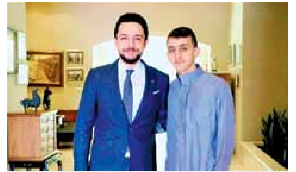
عمان استضاف ولي العهد الأمير الحسين بن عبدالله الثاني، الأربعاء، المفتي القرآني الشيخ محمد نوح العنانزة الحافظ لكتاب الله والفاخر الأول بمسابقة عالمية في حفظ القرآن الكريم.