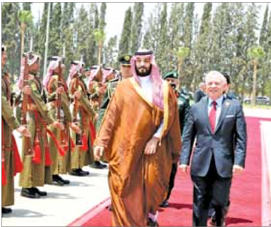
وأهلك في الأردن. استقبلت السعودية بقيادة بن عبدالعزيز سندا وعضدا لأمتهيا المعين والجار الأمين، لجميع الأشقاء أخي خادم الحرمين الشريفين الملك سلمان العربية والإسلامية، وستظل في الأردن، العرب لما فيه خير بلادنا وشعبنا.

وكان جلالته الملك وسمو ولي العهد السعودي أجريا مباحثات، يوم أمس الثلاثاء، تناولت العلاقات التاريخية التي تجمع البلدين والشعبين الشقيقين وسبل توسيع التعاون في شتى الميادين، وآخر التطورات إقليمياً ودولياً. ونشر جلالته الملك عبدالله الثاني تغريدة على موقع (تويتر) بمناسبة زيارة سمو الأمير محمد بن سلمان بن عبدالعزيز آل سعود ولي العهد، نائب رئيس مجلس الوزراء، وزير الدفاع في المملكة العربية السعودية إلى الأردن. وقال جلالته في التغريدة "أخي سمو الأمير محمد بن سلمان، شرفت دارك